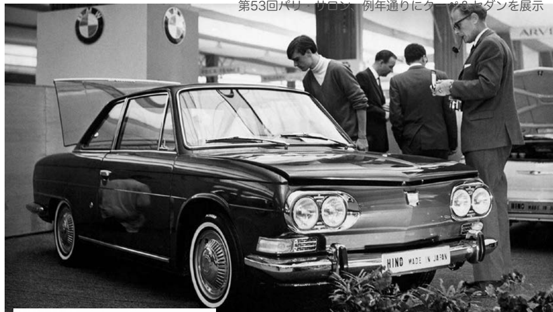
第53回パリ・サロン 例年通りにクーペ・セダンを展示