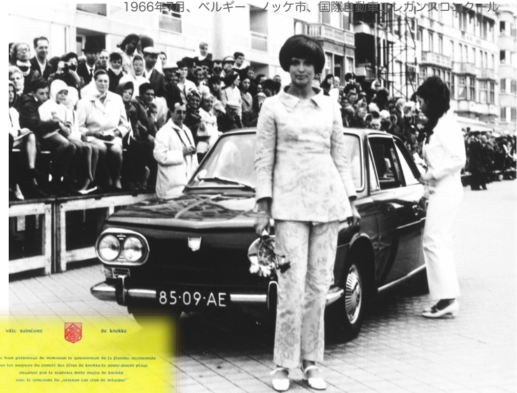
1966年7月、ベルギー・ノッケ市、国際自動車エレガンスコンクール