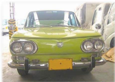
コロンビア (現地の日野工場)