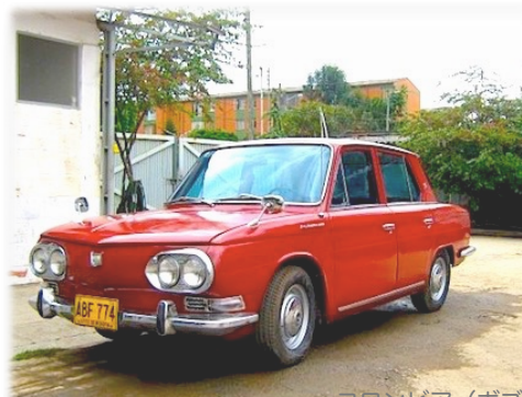
コロンビア (ボゴタ)