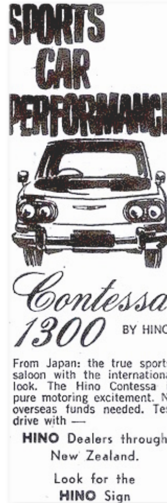
広告：スポーツカー並みの実力