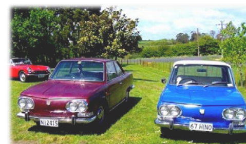
オーストラリア&ニュージーランド (オークランド)