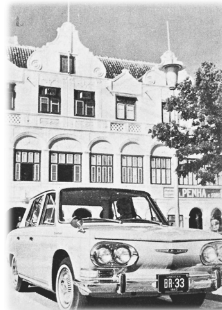
中米、プエルトリコ