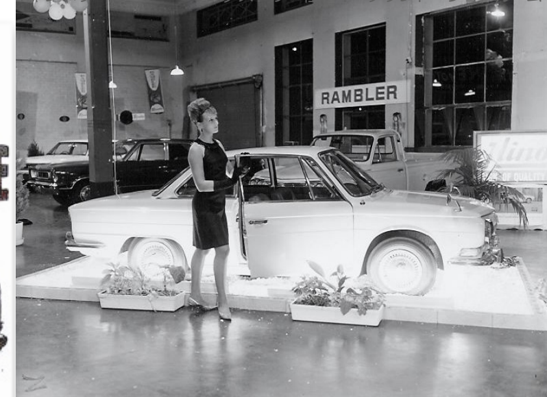
キャンベラ・モーター・インダストリー社、オークランド・ショールーム