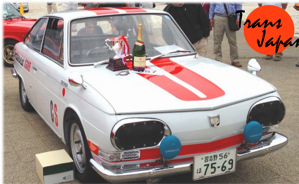
BLUE ATAMINO ITALIA 2015 (静岡県熱海市、2015年5月24日) イタリアン・デザイン車コンクール・デ・エレガンス総合優勝