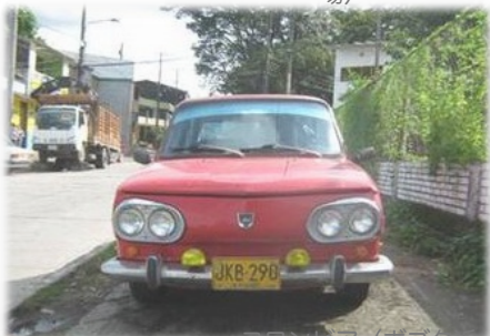
コロンビア (ボゴタ近郊)