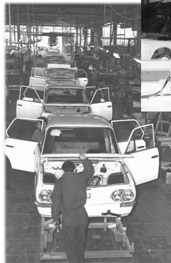
Autcars社コンテッサ生産工場

イスラエルの自動車企業、Kaiser-Illin Industries&Autocars社を通じて、早くも1963年、イスラエルは日野コンテッサの輸入を承認していた。