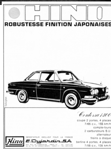
E. Dujardin SA社雑誌広告