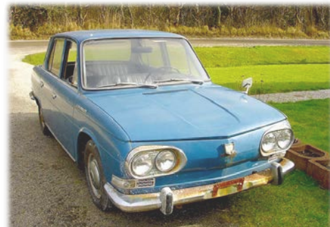
オランダ (スローベン近郊)