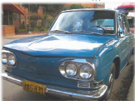
コロンビア (ボゴタ近郊)